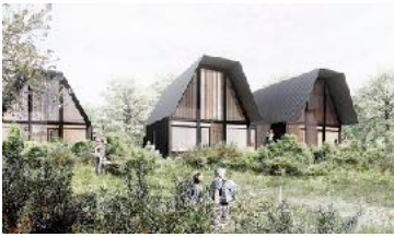
Grafik: Concept ApS/Niras